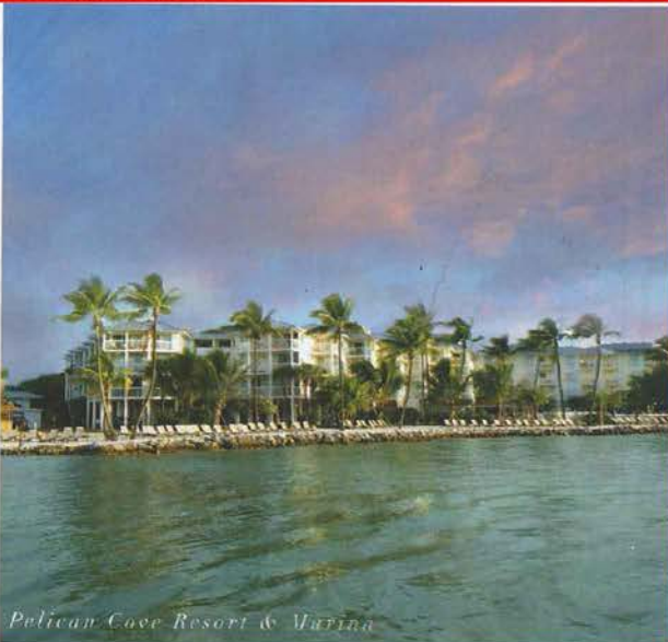
Pelican Cove Resort & Marina

Continuando hacia cayo Maratón, nos encontramos con otra joya hotelera, el maravilloso Little Palm Island Resort , (localizado en Little Torch Key) el cual es solo accesible por vía náutica. Con sus acogedoras suites (de techo de guano y románticas duchas a la intemperie) ¡se sentirá como si estuviera en un romántico oasis en una isla privada en el pacífico!