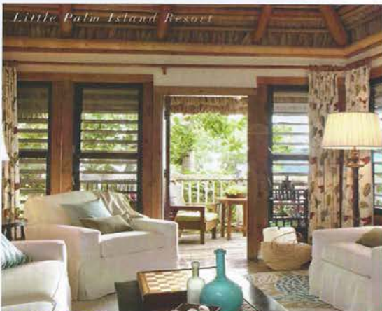
Little Palm Island Resort