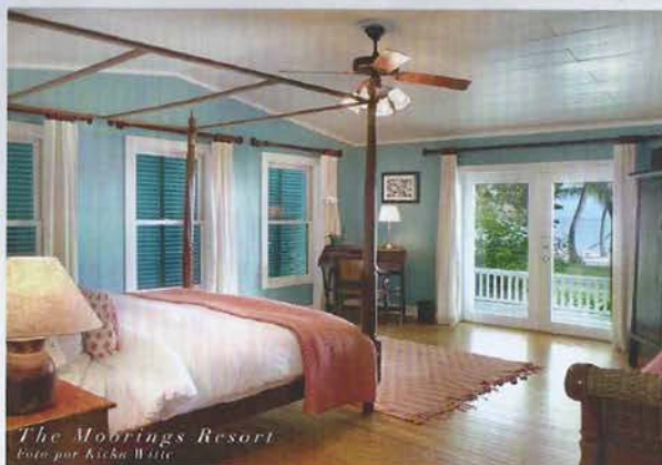
The Moorings Resort

Finalmente llegamos al último de estos bellos cayos, el divertido Cayo Hueso o Key West , ¡que es conocido mundialmente como la meca de la relajación playera! Aquí no solo podrán recorrer la linda calle Duval Street (repleta de pintorescos bares, restaurantes, galerías de arte y tiendas etc.), cenar en restaurantes fabulosos como Louie's Backyard y Latitudes (ambos a orillas del mar), sino que también pueden visitar varios museos (como la hermosa casa de Ernest Hemingway) y disfrutar de su famosa "fiesta del atardecer", la cual se celebra todos los días al caer el sol.